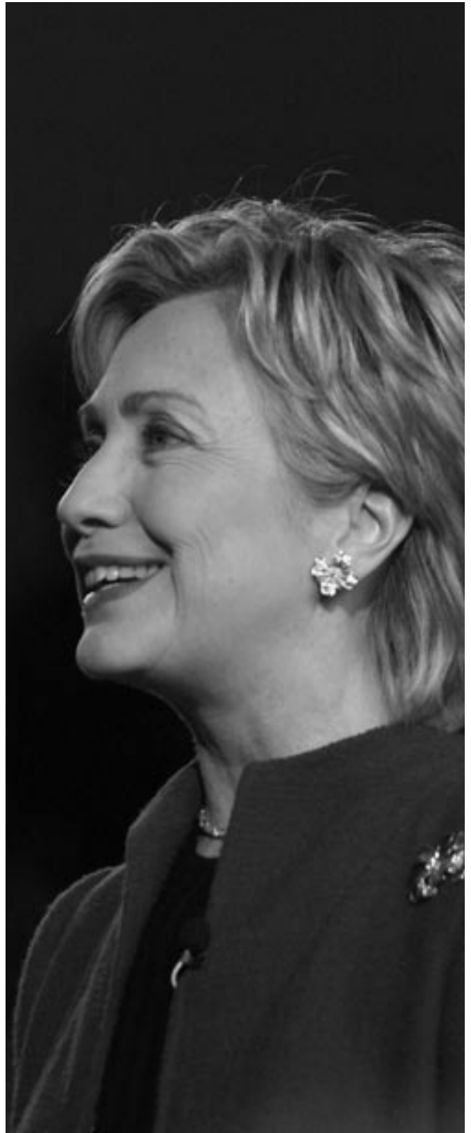
Hilary Rodham Clinton