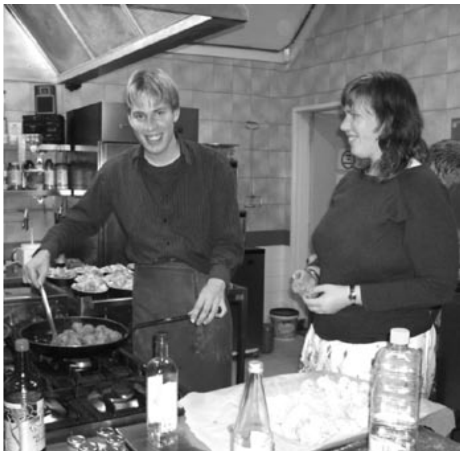
Met liefde bereid

De organisatie van de Wereldmaaltijd houdt dit goede gevoel graag vast en verheugt zich nu al - weer of geen weer - op de volgende Wereldmaaltijd! GK