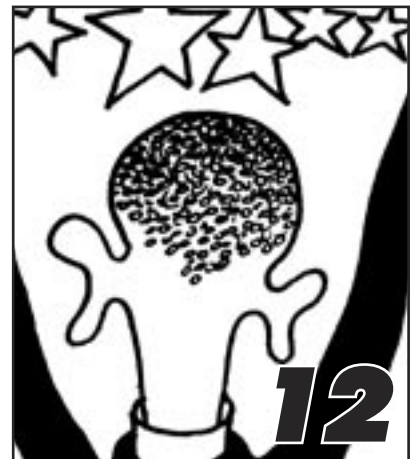
OBAMA EN DE HOOP