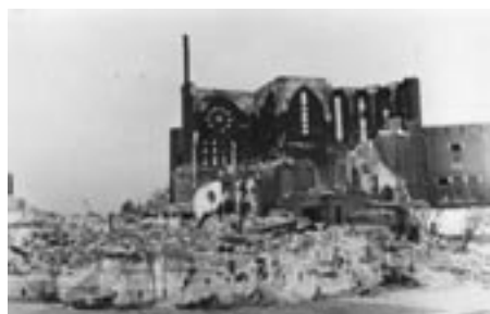
Mei 1940, Rotterdam verwoest