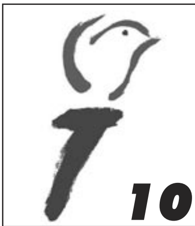
10 DANKBAARHEID VOOR VRIJHEID