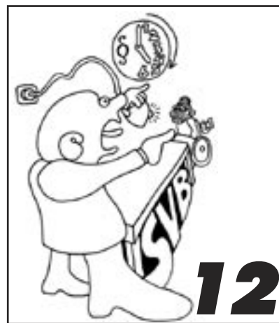
12 UITKERINGSGERECHTIGDEN AUTOMATISCH VERDACHTEN