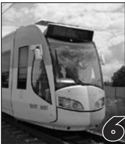
6 SEXY TRAM OF TOCH DE KABELBAAN?